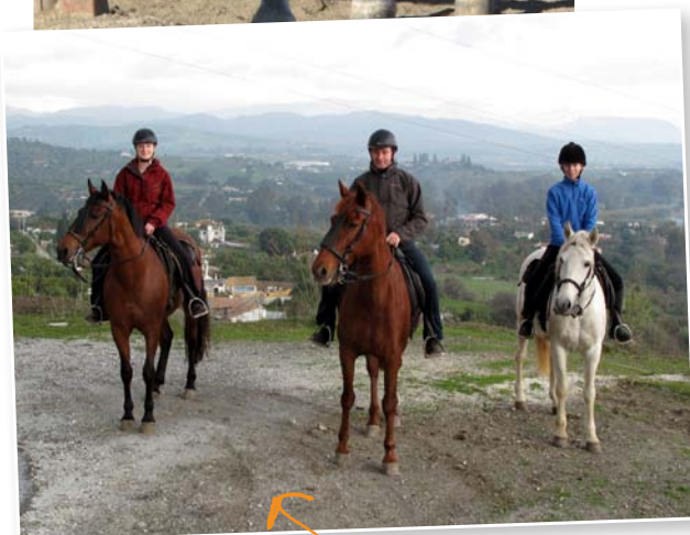
Links: ik en Tormenta